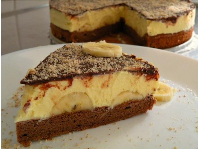
Slika 7: