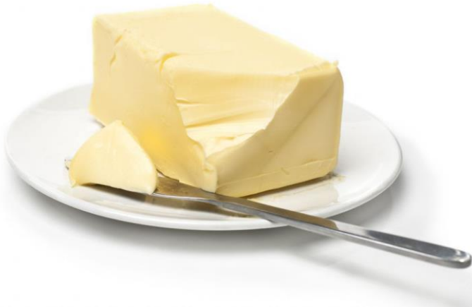
Slika 6: