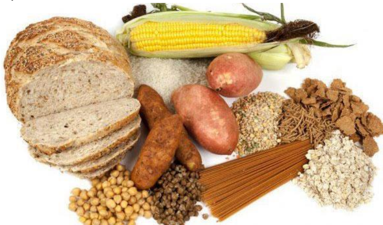
Slika 1: