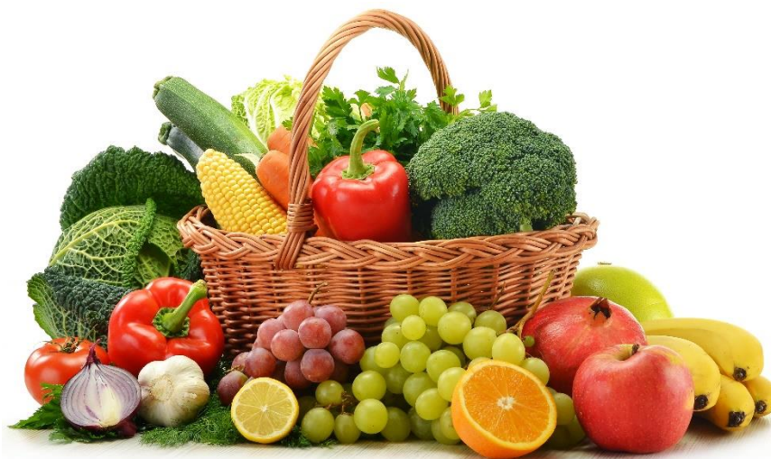
Slika 2: