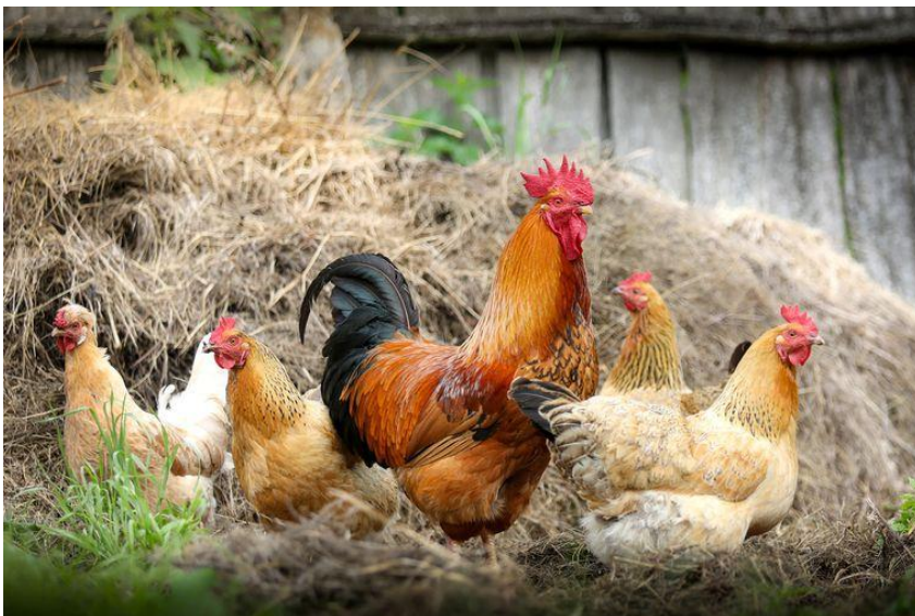
Vir slike: https://www.popsci.com/saving-rare-chickens/